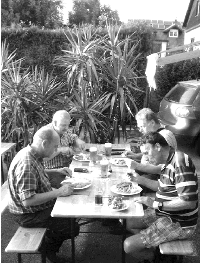
Er was natuurlijk ook tijd om gezellig te eten

alles in het Hongaars gaat zullen wij er nooit iets van snappen. Na veel heen en weergeschuif van de documenten, op- en afzetten van brillen, wisselen van de wacht en onder voortdurend roepen van: problem, problem , met als hoogtepunt opsluiting in een wachtlokaal weten de douaniers het zelf niet meer en laten ons doorgaan.