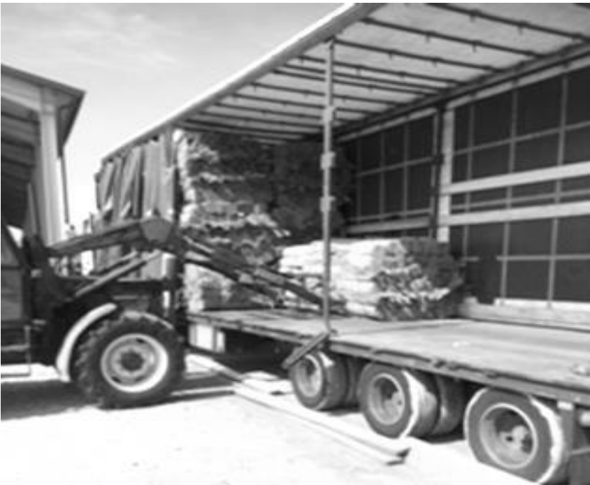
Riet laden voor de retourvracht

Op zaterdag worden de trailers gelost door een ervaren team van Roemeense helpers en op maandag brengen we nog een gedeelte naar Radauti Prut, een dorpje op het drielandpunt Roemenië, Moldavië en Oekraïne. Ook daar ondervinden we veel dankbaarheid.