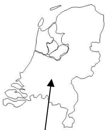
Lexmond en Hei- en Boeicop