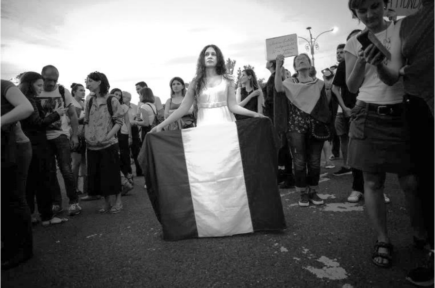
Een vrouw houdt een Roemeense vlag vast tijdens een protest in Boekarest.

Met steun van de Europese Unie leek Roemenië de voorbije jaren vooruitgang te boeken. Het anti-corruptieagentschap DNA kreeg tal van politieke kopstukken achter de tralies dankzij de daadkracht van hoofdaanklager Laura Codruta Kövesi. ‘De mentaliteit is langzaam aan het veranderen’, aldus Kövesi vorig jaar in gesprek met de Volkskrant.