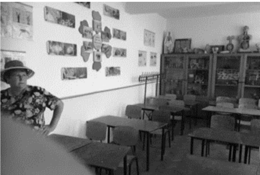
De schoolspullen werden direct op hun plek gezet

Aan boord van de vrachtwagens waren ook tientallen schoolsets, bestemd voor 2 scholen in de omgeving van Dorohoi, te weten een school in Ibanesti en een school in Radauti Prut. Deze schoolsets werden dankbaar uitgeladen en op hun plaats gezet.